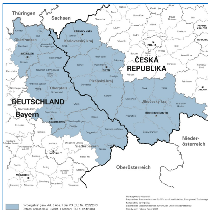
Obr. 1 - Programové území

Nařízení EU č. 1303/2013 nám jako orgánům programu EÚS předepisuje zpracovat každý rok tzv. Výroční prováděcí zprávu ("VPZ"). Tyto VPZ jsou publikovány na internetových stránkách našeho programu www.by-cz.eu . Obsahují všechny relevantní informace o programu za uplynulý rok, jsou však spíše technické povahy a pro externí čtenáře obtížněji čitelné. Proto je pro nás potěšením zpracovat společně s VPZ také informaci pro občany o obsahu této výroční zprávy. Při čtení tohoto textu je třeba mít na zřeteli, že informace, které zde budou zveřejněny, nepodávají detailní informace o obsahu programu a o jeho strukturách, ale představují zjednodušenou a srozumitelnou informaci o obsahu Výroční zprávy o provádění programu za rok 2016 a poskytují tak dobře čitelný přehled o nejdůležitějších událostech za uplynulý rok implementace programu. Jako první vstup, kde se můžete informovat o obsahu a hlavním zaměření česko-bavorského dotačního programu Vám doporučujeme zkrácenou verzi našeho Programu spolupráce "Shrnutí programu spolupráce". Tento dokument (stejně jako jeho delší technickou verzi) naleznete ke stažení v úvodu naší internetové stránky.