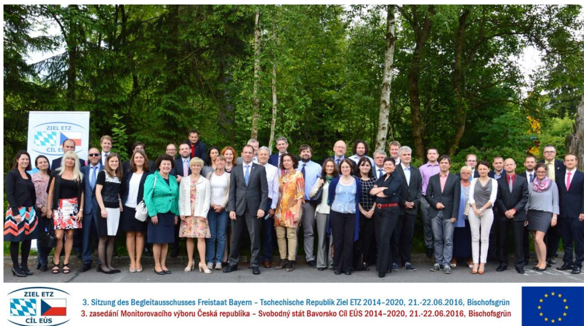
Obr. 2 - Skupinová fotografie třetího Monitorovacího výboru

Z nich bylo Monitorovacím výborem schváleno 35 projektů s objemem prostředků z EFRR ve výši více než 23,5 milionu EUR, z toho 15 projektů bylo schváleno s tzv. výhradou, kterou je nutné nejprve splnit (například vypuštění určité položky rozpočtu), než může dojít k právnímu navázání prostředků na projekt. Jen v první prioritní ose "Výzkum a inovace", která byla nově zavedena v programovém období 2014-2020 a ve které mohly vůbec poprvé předkládat žádosti o poskytnutí dotace malé a střední podniky, bylo vybráno 17 projektů a tím vyčerpána polovina prostředků určených pro tuto prioritu. Dále bylo schváleno "Zásadní usnesení o předkládání projektů Monitorovacímu výboru", ve kterém je detailně popsán výše uvedený postup v případě projektů, které nedosáhly 70 bodů, nebo které je nutno přepracovat. Byla rovněž představena zpráva k oblasti informace a komunikace. Zpráva obsahuje jak hodnocení dosaženého pokroku při plnění komunikační strategie, tak i výhled na opatření, plánovaná v následujícím roce. Analýza byla zpracována pomocí specifických komunikačních indikátorů Programu, které byly předem stanoveny v Komunikační akční strategii Programu.