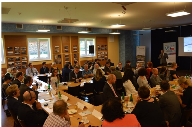
Obr. 5: - Výroční informační akce 2016: Konference na Modravě

Práce Programu s veřejností pokračovala také v roce 2016. V této souvislosti je nutno na prvním místě uvést naši každoroční informační akci, která tentokrát proběhla 27. a 28. září 2016 v České republice. Celá informační akce byla zahájena ve Spolkovém domě v Modravě odbornou konferencí, na které byli přítomni zástupci českých a bavorských ministerstev, českých krajů, euroregionů a měst a obcí z obou stran hranice informování o stavu Programu. Dále byly představeny projekty, které byly naším Programem podpořeny, jako například projekt Zlatá stezka - síť turistických cest na "Zelené střeše Evropy" nebo projekt PhotoStruk, který se zabývá analýzou historických fotografií z pohraničí. A následující den už byl plný turistiky: z obce Modrava a z města Železná Ruda byly organizovány dva tematické výlety podél řeky Vydry a Pancířským hřbetem. Veřejnost tak měla možnost seznámit se s projekty přímo na místě. Podle našeho názoru i s ohledem na reakce přítomných se akce zdařila a byla korunována úspěchem. Přesvědčte se však sami: