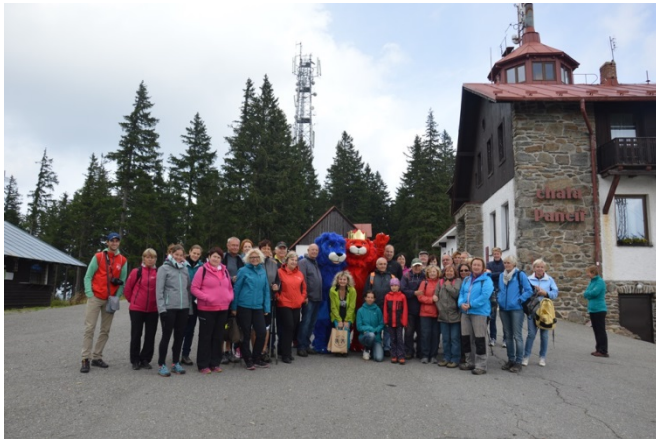
Obr. 6: - Výroční informační akce 2016: Výlet v okolí Pancířského hřbetu