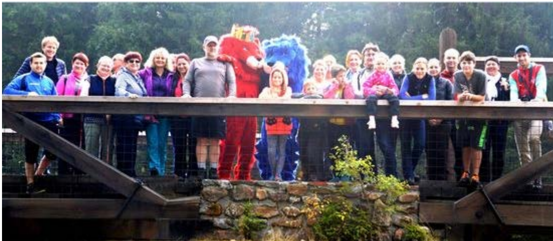
Obr. 7: - Výroční informační akce 2016: Výlet podél řeky Vydry

Informační a komunikační práce se však neomezuje pouze na dílčí akce, ale probíhá v rámci Programu neustále. V souvislosti s naším Program EÚS tak uspořádaly naše kraje, vlády a euroregiony řadu akcí, seminářů a přednášek pro více než 1 000 účastníků. Zprávy v médiích a tiskové zprávy nám pomáhají při další propagaci Programu na veřejnosti a zvýšení zájmu o Program. Také četná distribuce publikací a propagačních materiálů napomáhá subjektům programu při jeho programu.