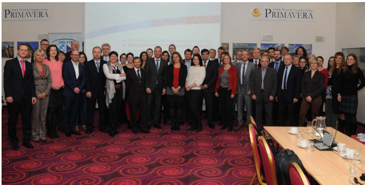
Obr. 3 - Skupinová fotografie ze 4. Monitorovacího výboru

Ve druhém kole bylo Monitorovacímu výboru předloženo k projednání 39 žádostí o poskytnutí dotace. Po intenzivních diskusích bylo schváleno 21 projektů, z toho 6 s výhradou. Stav v jednotlivých prioritních osách po čtvrtém zasedání Monitorovacího výboru vypadal následovně: