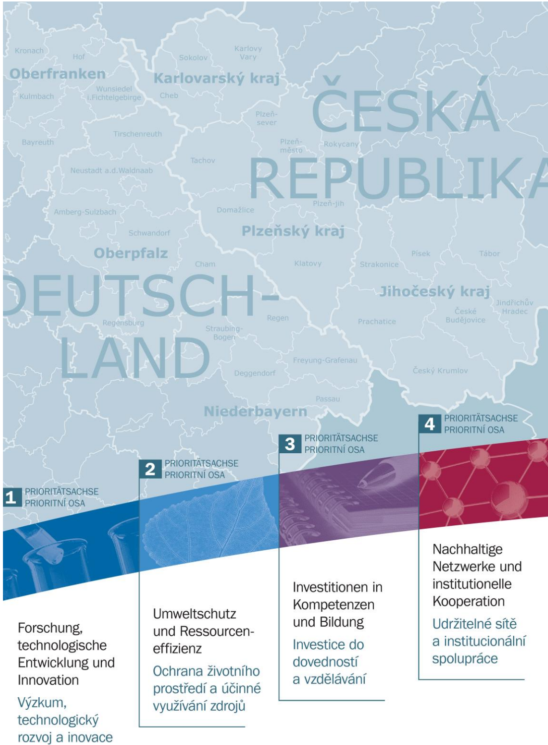
Abbildung 4 | Fördergebietskarte mit Piktogrammen und Namen der Prioritätsachsen des Programms